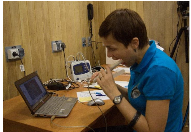
а. Мониторинг эксперимента