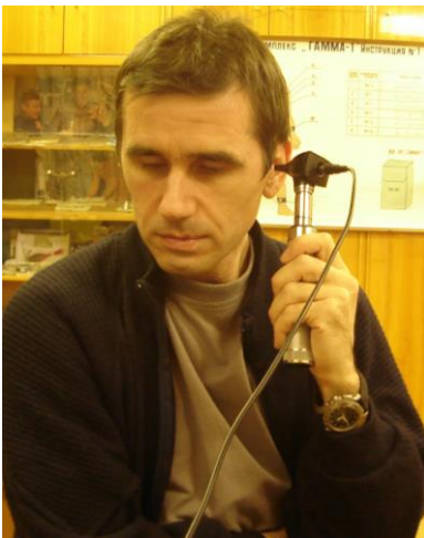
Рис.3. Маленченко Ю.И в ЦПК имени Ю.А. Гагарина (экспедиция МКС-16)

Исследование участков кожных покровов дало возможность определить наличие травматического повреждения участков кожных покровов и их клиническое состояние (ссадины, порезы, ушибы), а также состояние ногтевого ложа. Данные, полученные при осмотре зубочелюстного аппарата, позволили проследить за изменением состояния зубной эмали, наличием налетов, свидетельствующих о состоянии полости рта, а также изменением состояния пломб (нарушение целостности, разрушение), симптомами и наличием кариеса.